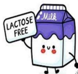
شیرکهداشت و درمان بهارستان

اگر شما بیماری "عدم تحمل لاکتوز" دارید، شیر بدون لاکتوز و یا پنیرهای سفت و ماست استفاده کنید.