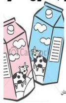
شیرکهداشت و درمان بهارستان

علی رغم شایعات نادرست در بین مردم، شیرهای پاکتی مدت دار بدون مواد نگهدارنده هستند.