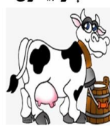
شیرکهداشت و درمان بهارستان

شیر غیر یاستوریزه را باید ده دقیقه در حال همزدن بجوشانید که دچار بیماری تب مالت نشوید.